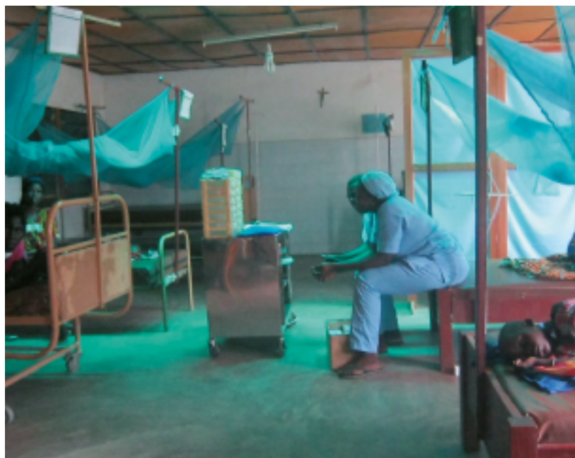
Foto: Sala de hospitalización del Centro Louis Amigó de Nikki

A lo largo del año 2013, la Fundación Salvador Soler ha contribuido a mejorar la salud de los enfermos atendidos en el Centro de Atención Sanitaria y nutricional Louis Amigó de Nikki, en el distrito de Bourgou, noreste de Benín, cubriendo el coste del tratamiento médico específico de determinados pacientes así como con la adquisición de material médico y quirúrgico necesario para el correcto funcionamiento del centro de salud.