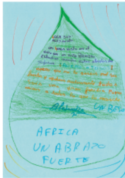
Foto: Expresión creativa sobre agua y desarrollo.

El Agua, un recurso limitado" en el Colegio Público de Educación Especial "Infanta Elena" de Madrid, destinado a los alumnos mayores del Centro y centrado en concienciar sobre la falta de acceso al agua en cantidad y calidad suficiente y al saneamiento que sufren diariamente 783 y 2.400 millones de personas en el mundo respectivamente. Al finalizar el mismo, los chicos desarrollaron su creatividad con un dibujo, en el que, bajo la silueta de una gota de agua, expresaban sus deseos, emociones y reflexiones.