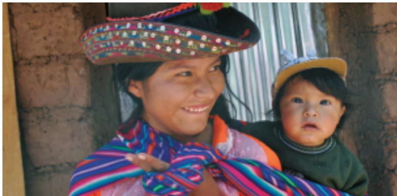
Foto: Familia campesina en Cangallo, Ayacucho.

Por medio de este proyecto se pretende promover y consolidar, con el apoyo y la experiencia de la Contraparte Local, la Compañía de Jesús, asociaciones productivas (miel, piedra blanca de Huamanga y tejidos) de las comunidades campesinas indígenas y en situación de extrema pobreza de la zona generando nuevas competencias en ellas de manera que pongan en valor su patrimonio artesanal y lo compatibilicen con alternativas turísticas sostenibles y adecuadas al entorno, revitalizando su hábitat y articulándose de manera adecuada al mercado generando ingresos complementarios en sus familias.