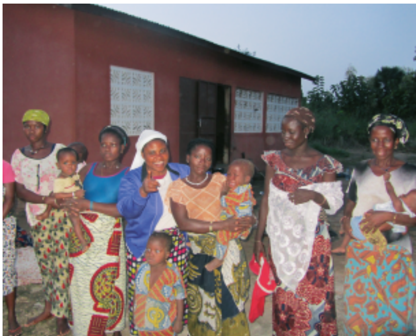
Foto: Mujeres e hijos internados en el Centro Nutricional junto a religiosa responsable. Al fondo, la cocina del mismo.