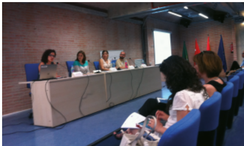
Foto: Jornada Fundación IDEAS.

La Fundación IDEAS co-organizó junto con la Fundación alemana Friedrich Ebert Stiftung estas jornadas en las que se exploró en el trabajo de las organizaciones de la sociedad civil por generar un mayor compromiso con la transparencia y la participación ciudadana en el trabajo parlamentario.