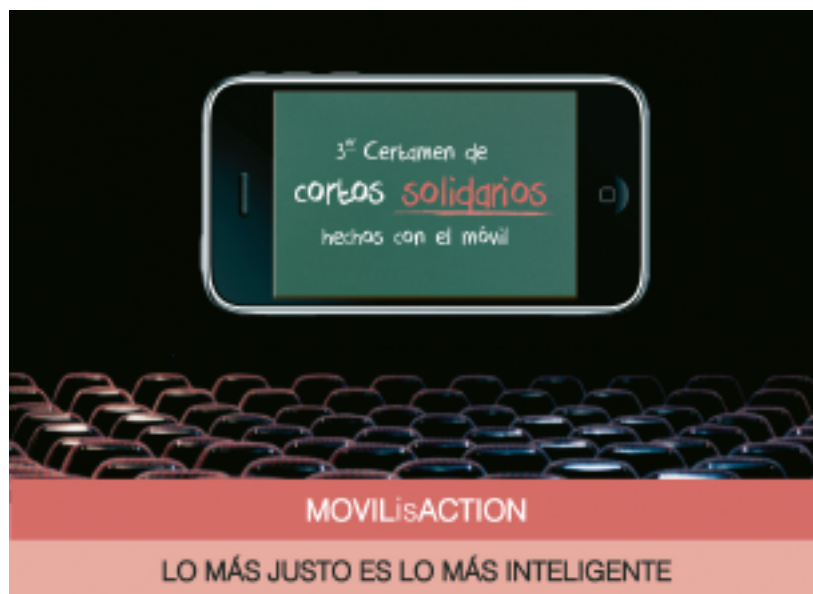
Foto: Cartel informativo III Edición Movilisaction.

Toda la información del certamen "Movilisaction" se encuentra en la página web: http://unmundosalvadorsoler.org/movilisaction/inicio.aspx